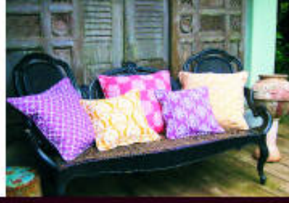
Teftişli Koleksiyonunda Fullamban kumaşları Bali ve Endonezya'da üretilmiş eliktir.